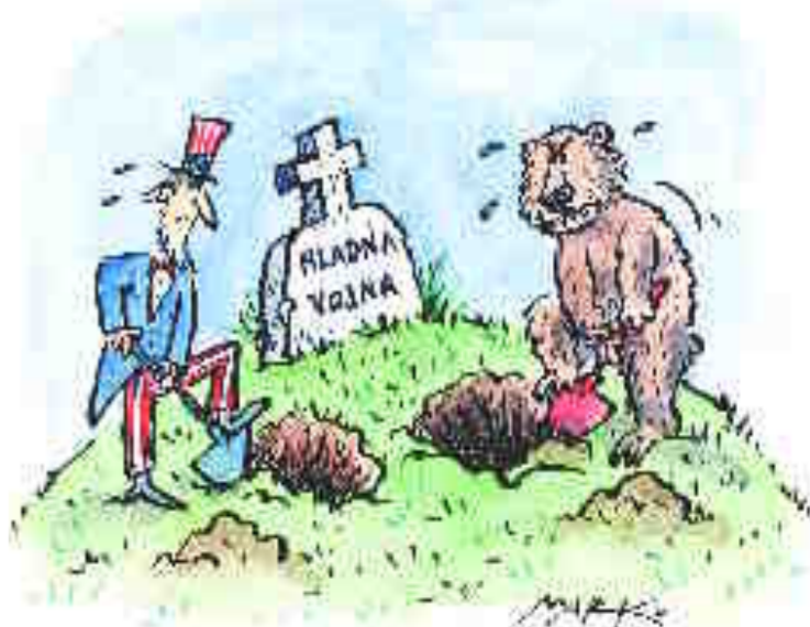
KARIKATURA MARKO KOČEVAR