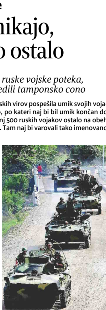
UMIK RUSKIH OKLEPNIKOV MIMO ŽUGDIDIJA NA ZAHODU UKRAJINE