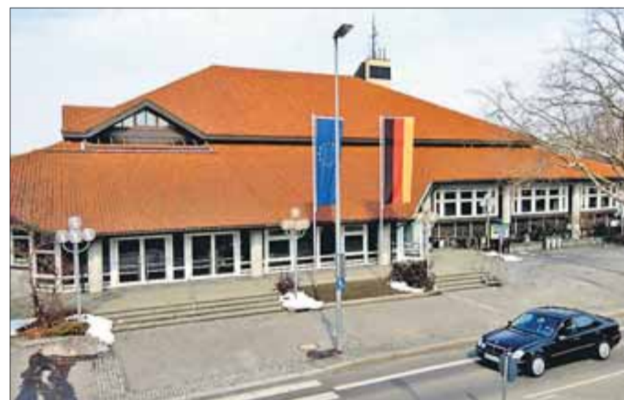
Kein Platz, keine Nebenräume, keine Elektronik: Die Inselhalle wird den Anforderungen der Nobelpreisträgertagung nicht mehr gerecht.