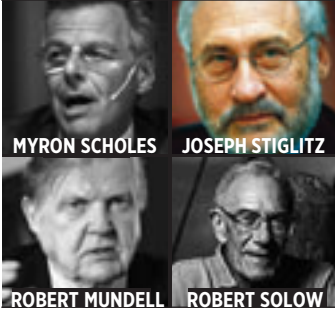
MYRON SCHOLES JOSEPH STIGLITZ ROBERT MUNDELL ROBERT SOLOW

Dit is het tweede in een reeks van exclusieve interviews met vier Nobelprijswinnaars Economie.